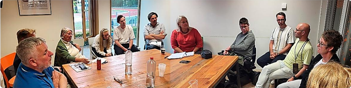
Figuur 3: Focusgroep: Parasport - Doing