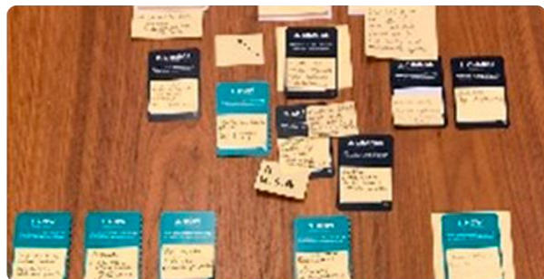
Figuur 2: ontwikkelen van de 'Theory of Change' voor Urban Sports met behulp van het Erasmus 'Journey of Progress' kaartspel.

De focusgroepen boden deelnemers — waaronder managers, sporters, ouders en vrijwilligers — de gelegenheid om openlijk te bespreken welke problemen zij binnen hun verenigingen ervaren. Deze gesprekken leverden kwalitatieve inzichten op in de huidige situatie, die essentieel zijn om later het effect van de projecten te kunnen meten.