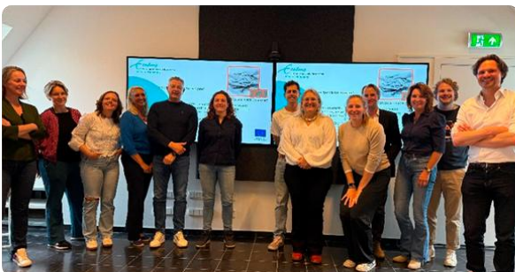
Figuur 1: Presentatie Baseline report bij de Expertmeeting

De Erasmus Universiteit heeft een baseline report opgesteld op basis van informatie van de deelnemende bonden en gemeenten, en van de uitkomsten van diverse focusgroepen. Deze focusgroepen zijn georganiseerd met organisaties en verenigingen uit onder meer skaten, freerunning, dans, straatvoetbal, amateurvoetbal, cricket en hockey. Het rapport richt zich op het in kaart brengen van de belangrijkste uitdagingen waarmee clubs en verenigingen te maken hebben op het gebied van discriminatie, inclusie en diversiteit.