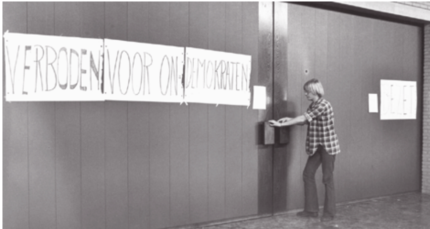
In januari 1977 bezetten sociologiestudenten de senaatszaal

1977 In januari 1977 stappen de sociologiestudenten tijdelijk uit de faculteitsraad en bezetten de senaatszaal op Woudestein. De studenten vinden dat er onvoldoende geluisterd wordt naar hun argumenten voor verbreding van studiemogelijkheden. Op 9 september 1977 halen 32 studenten hun kandidaatsdiploma, waarvan 13 avondstudenten. In zijn toespraak bij de diploma-uitreiking geeft prof. dr. W.A.A.M. de Roos aan dat met ingang van komend