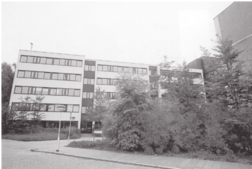
In 1984 verhuist de faculteit naar het F/G gebouw