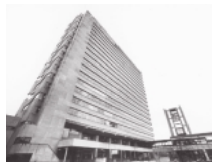
In 1969 neemt de faculteit haar intrek op de 13 e en 14 e verdieping van de hoogbouw op Woudestein

In december 1969 verhuist de sociale faculteit van de Pieter de Hoochweg naar de zojuist gereedgekomen hoogbouw op Woudestein.