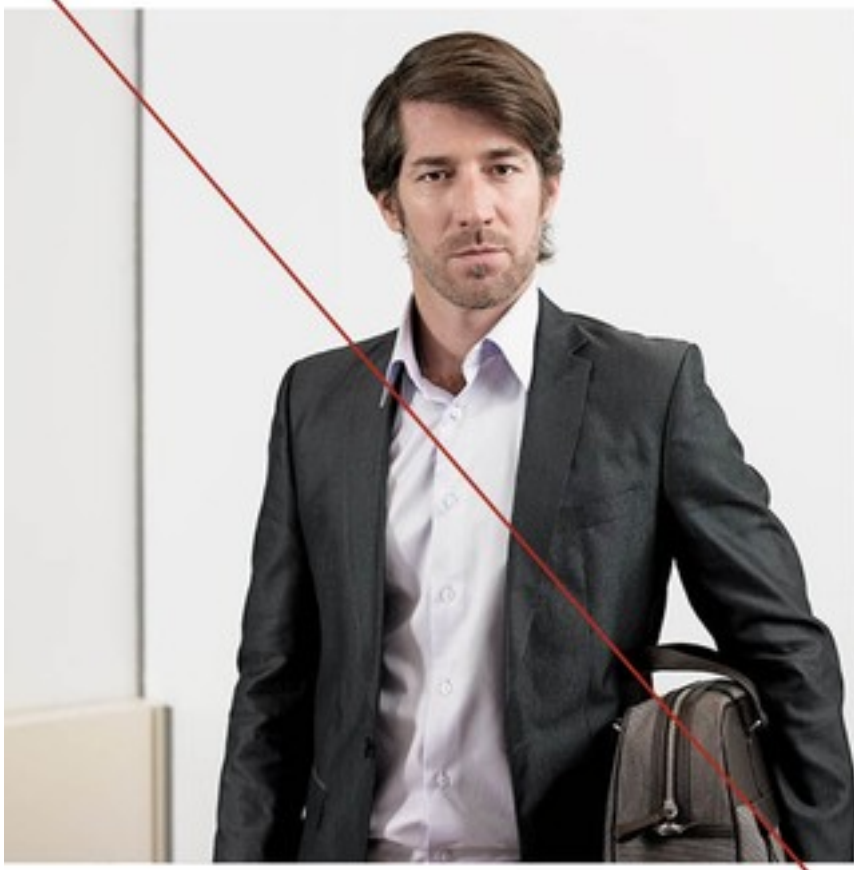
Arrogante blik, gekunstelde houding