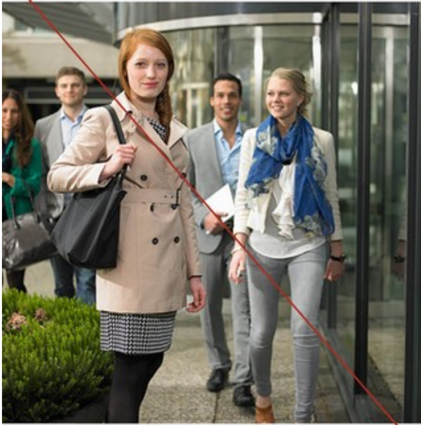
Zeer gekunstelde situatie