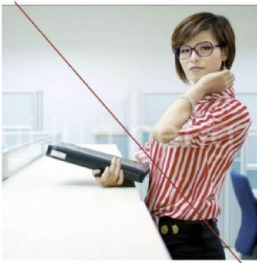
Onnatuurlijke pose + gekunstelde context