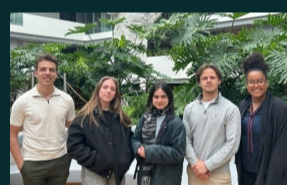
Studenten presenteren onderzoek masterscriptie bij het Ministerie van Financiën in het kader van het duurzaamheidsproject