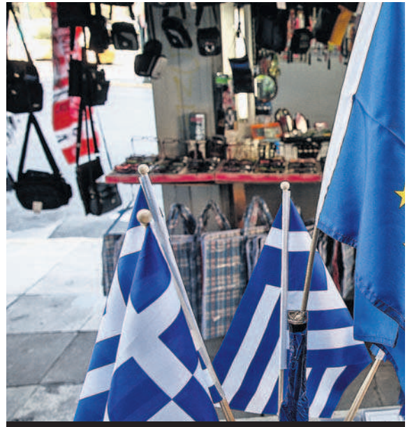
Griekse vlaggetjes, en toch ook nog eentje van de Europese Unie, bij een kraampje in de havenstad Piraeus.

entelisme, de oligarchen en de privileges van gevestigde belangen zoals merk en leger zouden allemaal moeten worden aangepakt. De kans dat zo'n deal er komt, wordt echter met de dag kleiner. Premier Tsipras en zijn communistische consorten zijn vooral geïnteresseerd in schuldreductie en het in stand houden van een omvangrijke publieke sector. Zij lijken niet te beseffen dat in Europa de landen zelf verantwoordelijk zijn voor het genereren van welvaart voor hun burgers, en niet blijvend een beroep kunnen doen op Europese solidariteit. Griekenland is geen kale kip, zoals Arnon Grunberg onlangs in de Volkskrant beweerde, maar een bonte verzameling