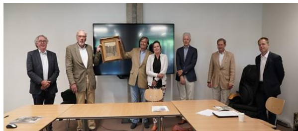
Overdracht van het schilderij van A.W. van Voorden, 7 juli 2020

Leeskabinet in 2020. Het schilderij is inmiddels schoongemaakt, waarbij de donker verkleurde vernislaag is verwijderd. In 2021 is het schilderij in een nieuwe lijst gezet.