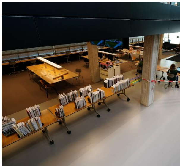
De UB als uitleenpunt van gereserveerde boeken (mei 2020)