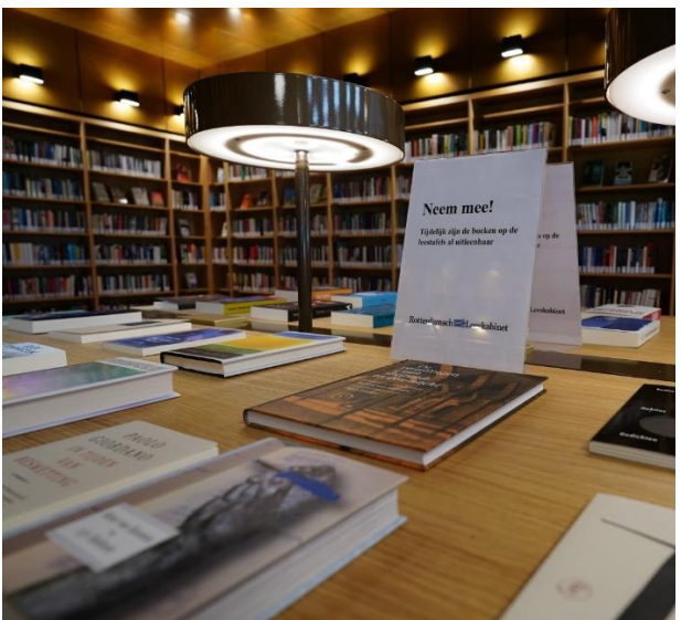
Het leeskabinet in coronatijd: lenen van de leestafels zonder reserveren.