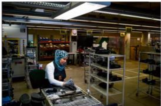
Werksters van Emma Safety Shoes in Brunssum. Ze maken ook speciale modellen voor oprichters. Emma Safety Shoes' veelzijdige sociale werkplaats levert kwant van alle veiligheidsschoenen in Nederland