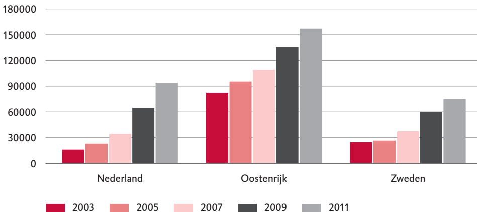
Figuur 1 Absolute aantallen Midden- en Oost-Europeanen in Nederland, Oostenrijk en Zweden (2003-2011)