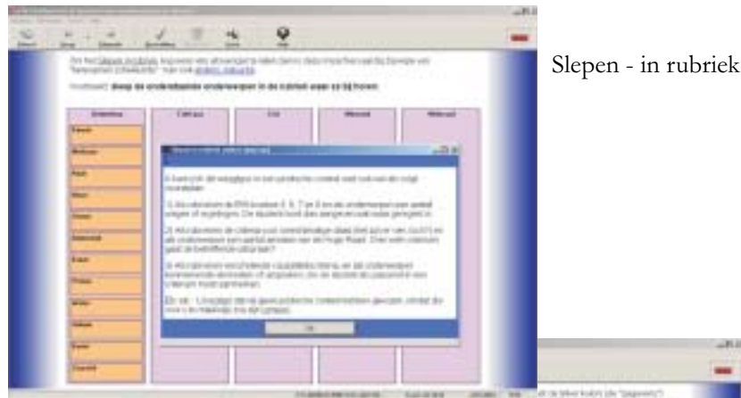
Slepen - in rubriek