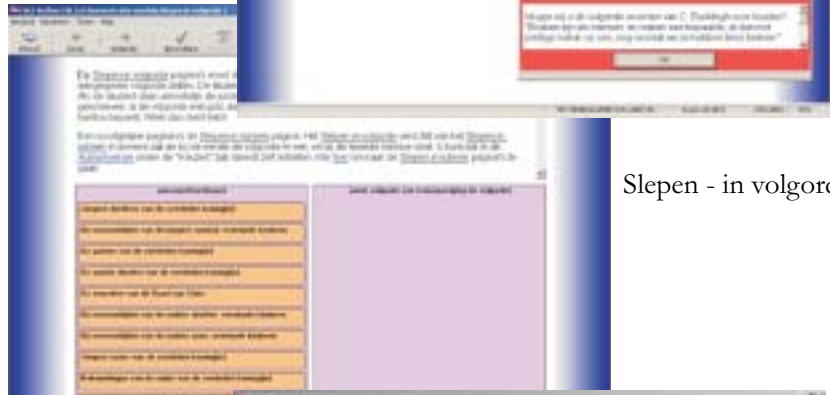
Slepen - in volgorde