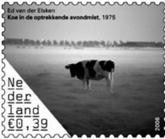
Nederlandse koe in polderland