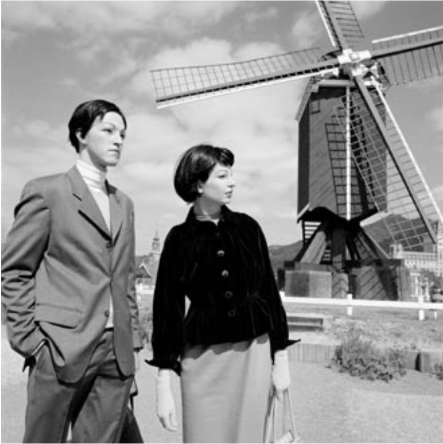
Een molen – een caniek Nederlands symbool – nagebouwd in themapark Huis ten Bosch Stad, Nagasaki 2001

bron: Barbara Visser, A Day in Holland/ Holland in a Day , 2001, courtesy Annet Gelink Gallery