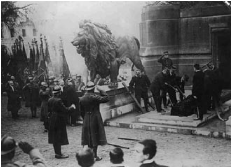
Bijzetting van de onbekende soldaat, symbool van de Belgische nationale eenheid, Brussel 11 november 1922

Natiestaten hebben dus op grote schaal controle uitgeoefend over de opbouw van het collectieve geheugen van een land waarmee specifieke verhalen werden gecreëerd. Omdat de oriënterende functie van historisch besef zich voltrekt in het vertellen van een verhaal en de natiestaat door zijn drang om de collectieve herinnering exclusief voor zich op te eisen een belangrijke producent van verhalen is, zijn historisch besef en nationale identiteit nauw met elkaar verbonden en resonanceert de nationale canon nog sterk in de hedendaagse historische cultuur.