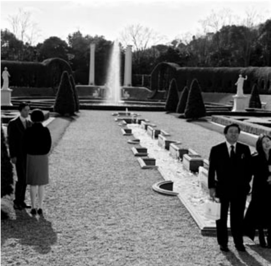
Reconstructie van de tuin van Huis ten Bosch, themapark Huis ten Bosch Stad, Nagasaki 2001

wezen: goed geschiedenisonderwijs kan niet tot stand komen zonder enthousiaste en ervaren docenten die hun leerlingen weten te boeien. De huidige tendens om alles te canoniseren en te 'vertijdvakken' laat weinig ruimte voor hen over. Het verontrustende is echter dat de bevoegdheidsregeling voor de vakbekwaamheid bij wet is afgeschaft. Docenten zijn nu multi-inzetbaar. Het 'nieuwe leren', met grote kracht bepleit tijdens de invoering van de Tweede Fase, is de onderwijskundige legitimatie van deze kostenbesparende maatregel. Terwijl de overheid overweegt om 'gebrekig historisch besef' onder jongeren tegen te gaan door een top-down invoering van een nationale canon, worden docenten steeds minder beschouwd als vakdeskundigen en steeds meer als uitvoerders en procesbegeleiders.