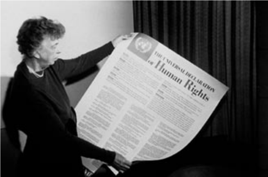
Eleanor Roosevelt aanschouwt in november 1949 de Universele verklaring van de rechten van de mens in het VN-hoofdkwartier.