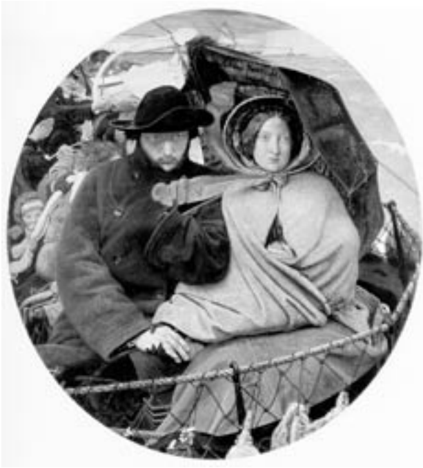
Emigranten verlaten het negentiende-eeuwse Europa. 'The last of England' van Ford Madox Brown (ca. 1855)

de nationale staat als een anachronisme. Ook was het niet langer overtuigend de 'algemene geschiedenis' op te vatten als de geschiedenis van de 'omgeving' van de eigen natie. De logische consequentie zou een historische canon van de 'menschheidsgeschiedenis' zijn geweest. Maar die stap werd niet gezet. In plaats daarvan hield iedere nationale staat vast aan het eigen nationale curriculum. Men handhaafde de oude tweedeling in nationale ('vaderlandse') en 'algemene' geschiedenis, en voegde daar naar behoefte nieuwe thema's aan toe. Zelfs cursussen die onder het etiket wereldgeschiedenis werden aangeboden behandelden meestal de Europese geschiedenis plus enkele lessen over 'andere delen' van de wereld. 9 Het is deze ad hoc amendering van de nationale canon die heeft geleid tot de huidige toestand. De onduidelijkheid over het wat en het waartoe van het geschiedenisonderwijs kan niet op de rekening van vaardigheden-freaks en onderwijsbureaucraten worden geschreven (ook al hebben die er het hunne aan bijgedragen). Dat zou al te gemakkelijk zijn. De echte oorzaak van de huidige problemen is het vasthouden aan een verouderde indeling en inhoud van de historische kennis in een veranderde wereld.