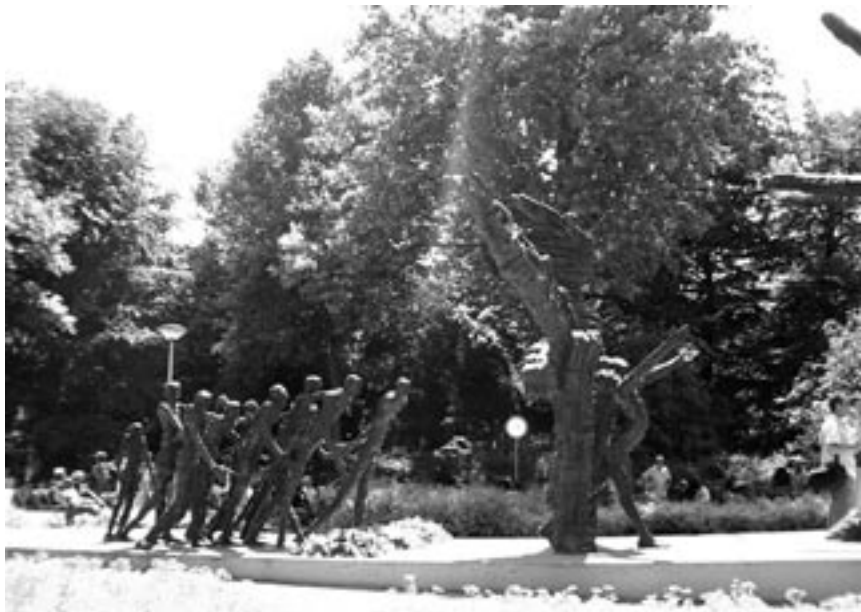
Het Nationaal Slavernijmonument te Amsterdam, een in 2002 onthulde beeldengroep van Erwin de Vries.