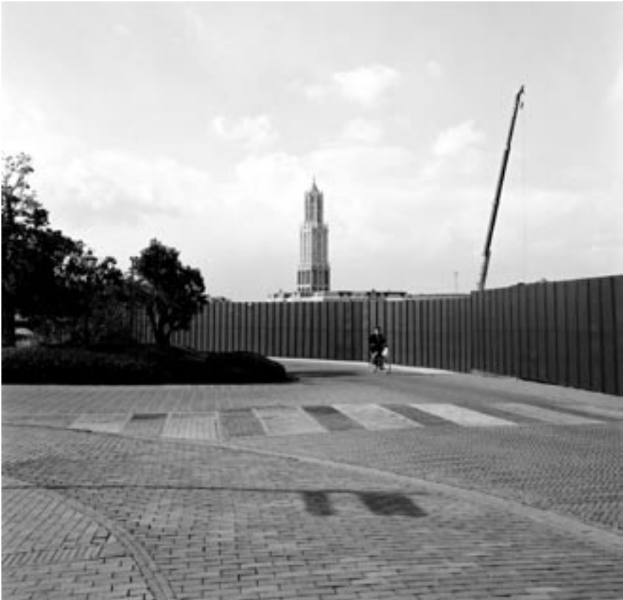
De Utrechtse Domtoren – een canoniek Nederlands symbool – nagebouwd in themapark Huis ten Bosch Stad, Nagasaki 2001

Is Leerssen hier te streng of bezondigen Nederlandse historici zich in de praktijk inderdaad aan ondoordachte, instrumentele geschiedenis? Zijn hun hoogstaande intellectuele reserves alleen maar vrome praatjes voor de zondag, die als de werkweek begint al weer vergeten zijn? Een kleine historiografische balans van de recente canonpublicistiek levert een gemengd beeld op.