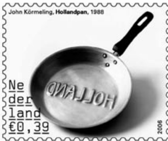
Keukenattribuut als nationaal symbool

Dat ligt naar mijn smaak anders in het onderwijs. Daar kan en mag niet zonder meer toegegeven worden aan de emotioneel begrijpelijke behoefte aan vastigheid. Die vindt vooral uitdrukking in de roep om een culturele en historische canon, die het gevaar in zich draagt van een gemakzuchtige en zelfgenoegzame verstening van 'onze' collectieve culturele identiteit. Vanuit een oogpunt van sociale en culturele cohesie is er bij veel politici en beleidsmakers behoefte aan een vaste canon, waarvan gehoopt wordt dat die ook een politieke consensus zal belichamen. En net als in het ruimere politieke debat over multiculturalisme hebben geesteswetenschappers, in dit geval voornamelijk historici, wel begrip voor deze wens. De meeste historici wijzen canonvorming dan ook niet principieel af en zien het zelfs als hun taak om er aan mee te werken.