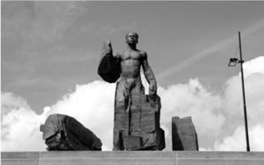
Een strijdbare, naakte Anton de Kom zoals uitgebeeld in Amsterdam door Jikke van Loon in 2006.

te onderstrepen. In toenemende mate wordt getracht om voorheen genegeerde of onderbelichte historische onderwerpen die binnen de eigen gemeenschap van belang worden geacht op passende wijze een duidelijk zichtbare plaats te geven. Het kan zowel gaan om het zo naadloos mogelijk aanpassen aan de bestaande historische cultuur als om het presenteren van een relatief nieuw 'tegen'verhaal; het kan gaan om nieuwe of reeds bekende historische thema's, om aanvullende interpretaties of om geheel nieuwe interpretaties.