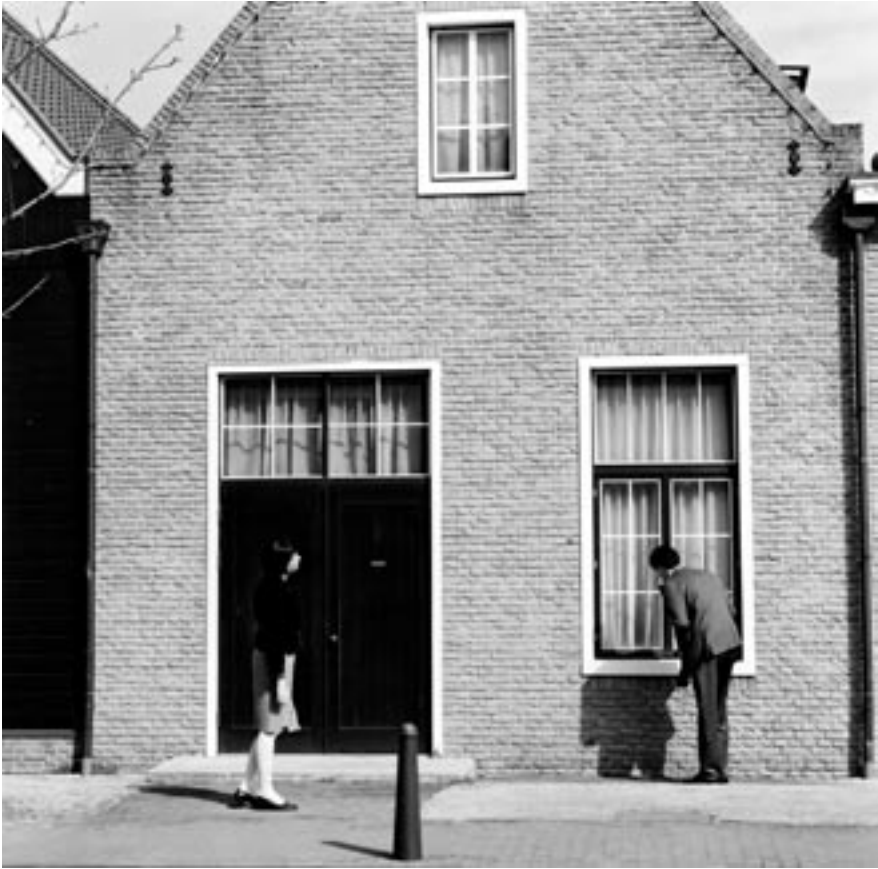
Een 'klassiek' Hollands huis, nagebouwd in themapark Huis ten Bosch Stad, Nagasaki 2001 bron: Barbara Visser, A Day in Holland/ Holland in a Day , 2001, courtesy Annet Gelink Gallery

die uitgedragen moet worden: 'Nederland moet opnieuw een vaderlandse geschiedenis krijgen, ontdaan van valse schaamte en valse superioriteit over het burgerschap...' 40