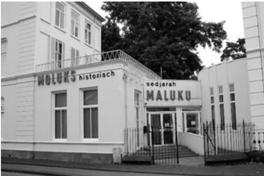
Het Moluks Historisch Museum / Museum Sejarah Maluku in Utrecht.

Wel zijn er instellingen als het Moluks Historisch Museum in Utrecht en het Indisch Huis in Den Haag die zich, met behulp van professionele historici, bekommeren om materieel en immaterieel erfgoed. Het Moluks Historisch Museum, dat in november 1990 zijn deuren opende, is naar eigen zeggen ‘een geschenk van de Nederlandse regering aan de Molukse gemeenschap in Nederland uit waardering voor de inzet van met name de eerste generatie die in 1951 naar Nederland werd overgebracht’; anderen spreken eenvoudigweg van een ‘afkoopsom’. 25 Het museum kwam voort uit afspraken die het kabinet-Lubbers in april 1986 met de Molukse minderheid maakte toen destijds, na eerdere radicale acties van Molukse jongeren in de jaren 1970, opnieuw een zekere radicalisering dreigde. De afspraken hadden vooral betrekking op huisvesting en werkgelegenheid, maar daarnaast werd in een streven naar genoegdoening onder meer de bekostiging van een Moluks Historisch Museum toegezegd. 26 Behalve het geven van een beeld van de geschiedenis van de Molukse gemeenschap in Nederland en van de achtergronden van de komst naar Nederland wordt getracht de Molukse kunst en cultuur in Nederland te stimuleren.