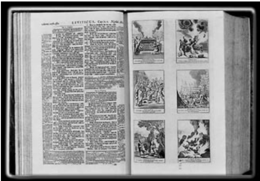
Nederlandse versie van de christelijke canon: de Statenbijbel in een editie uit 1729.

Kan er onder deze omstandigheden nog wel een canon bestaan? In het recente canon-debat in Nederland hebben nogal wat voorstanders van een nieuwe nationale canon de indruk gewekt dat het hen te doen is om een lijstje weetjes, of een verplichte literatuurlijst. Een echte vitale canon is echter zowel meer als minder dan dat. De christelijke canon is een goed voorbeeld: de kern ervan was de Bijbel, een tekst die zijn enorme kracht ontleende aan de traditie van commentaren, uitleg en morele lessen die er omheen gewoven waren, en die door iedere generatie weer opgepakt, opnieuw geïnterpreteerd en dus ook veranderd werd. Zonder kennis van de Bijbel kon iemand de codes van een christelijke samenleving niet begrijpen. Wie de Schrift niet kende was een intellectuele en morele analfabeet. De commentaren en polemieken die er van generatie op generatie omheen gesponnen werden, bevestigden de centrale positie van de