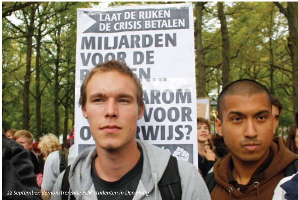
22 September: demonstrerende EUR-studenten in Den Haag

Lees meer over het Centrum voor Historische Cultuur op pag. 16.