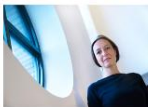
'Hof Arnhem maakt denkfout': Katholiek Nieuwsblad