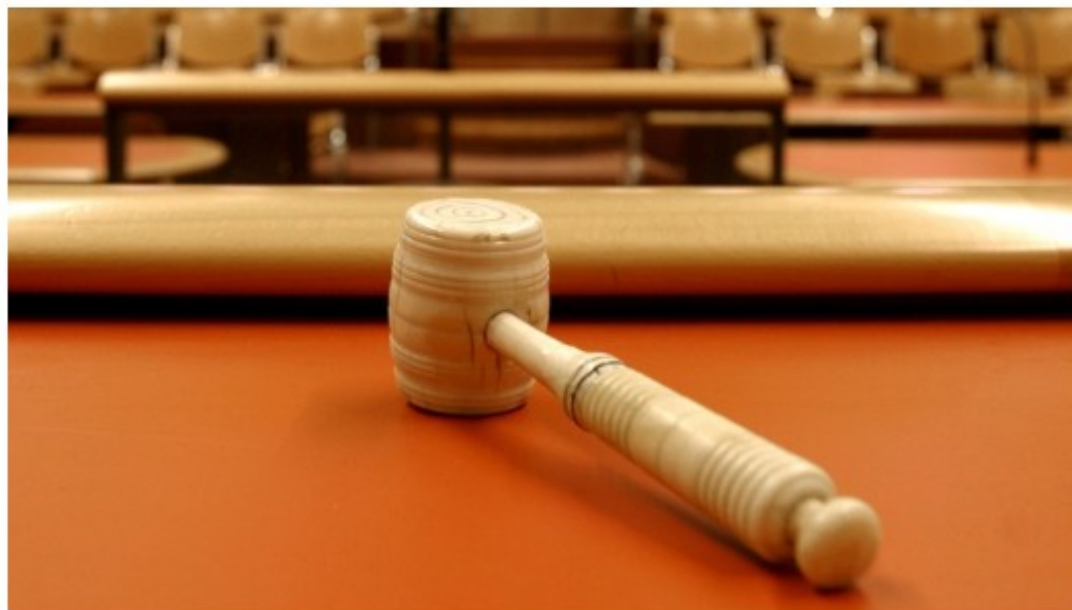
Hamer in de rechtszaal.

donderdag 10 okt 2013, 14:06 (Update: 10-10-13, 14:18)