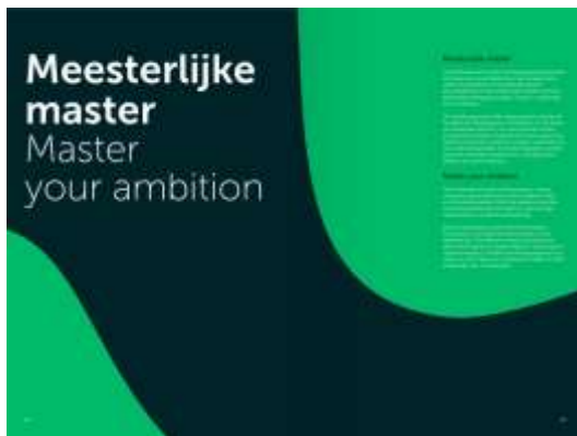
Tweetaligheid op een tussenpagina

Hetzelfde geldt voor de introductieteksten. Deze plaats je naast of onder elkaar. Beiden teksten zijn aan elkaar gelijk.