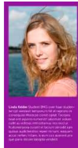
Kader, tekst en beeld