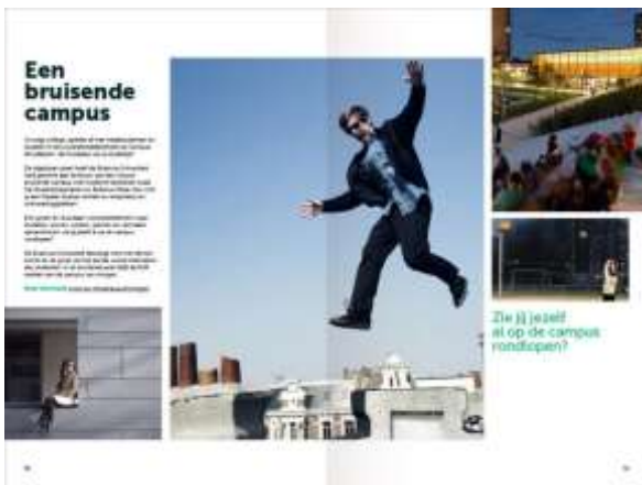
Spread, fotowolk met meerdere beelden