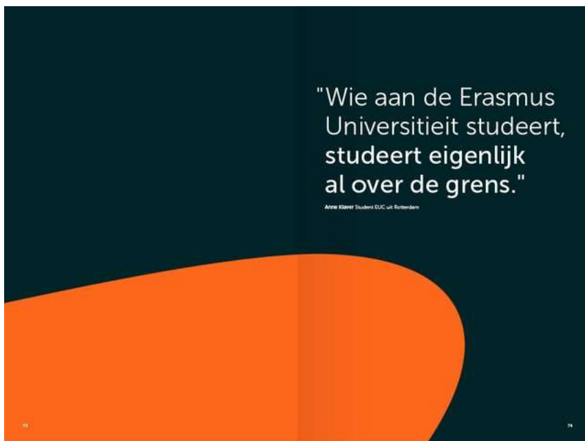
Tussenspagina, verbindende vorm met quote (facultair)