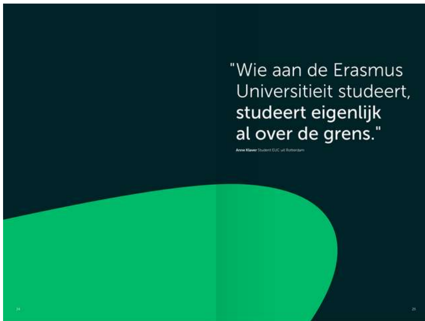
Tussenspagina, verbindende vorm met quote