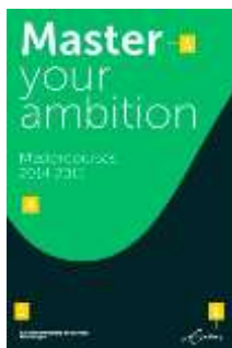
Cover in twee kleuren

Hoofdtitels van uitgaven en titels in hoofdstukken worden niet in kapitalen gezet. Het eerste woord van de titel begint met een hoofdletter, maar de rest van de titel is in onderkast (kleine letter).