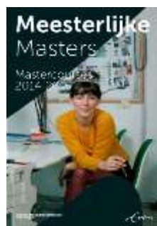
Cover met beeld