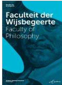
Cover met beeld in 1 kleur (facultair)

Let op! Wanneer het een facultaire uiting is, dient ook de secundaire logoset erop te staan (2).