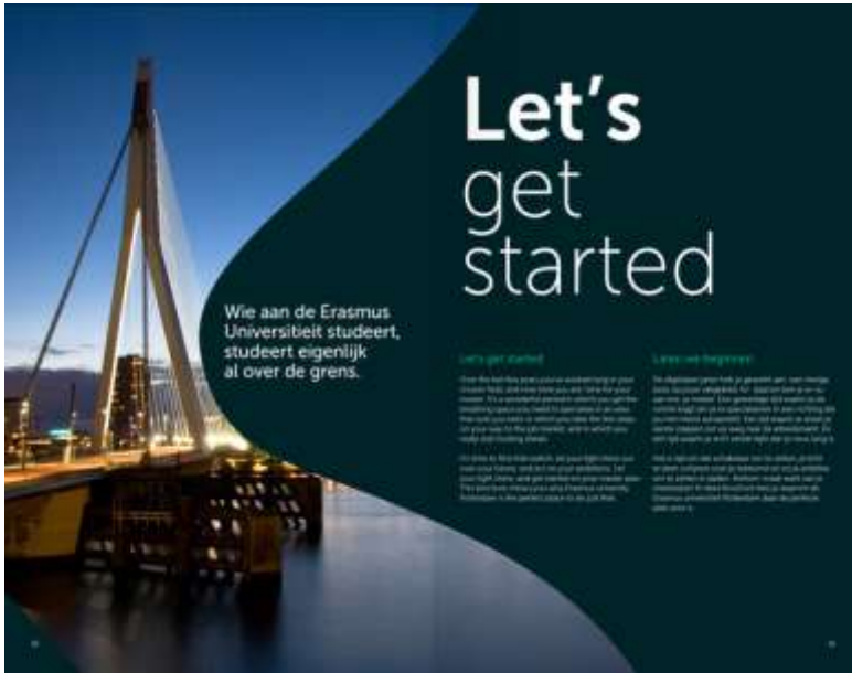
Tussenspagina, verbindende vorm met tekst en beeld