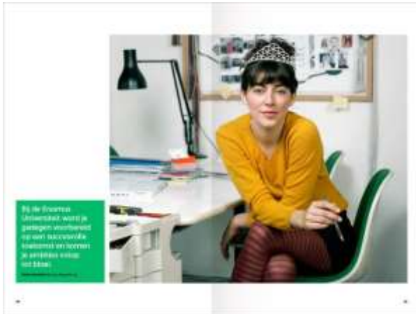
Spread, fotowolk met 1 beeld