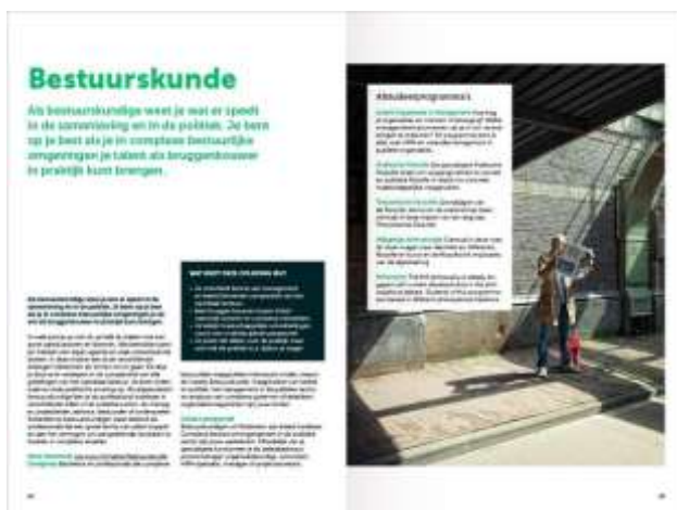
Spread, kader en beeld