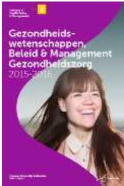
Cover met beeld (facultair)