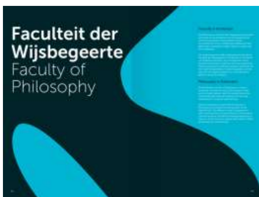
Tweetaligheid op een tussenpagina (facultair)