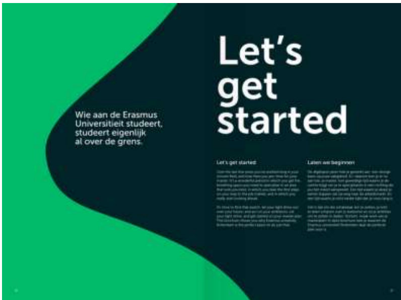
Tussenpagina, verbindende vorm, tekst en contrastrijke typografie.

Wat betreft typografie is het ook hier belangrijk om het contrast te behouden tussen titel en bodytekst. Doe dit door een grote aansprekende titel of quote ten opzichte van de kleinere dieperliggende informatie te plaatsen.