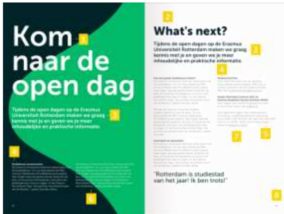
Hiërarchie, voorbeeld 1