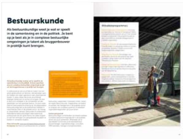
Spread, kader met beeld (facultair)