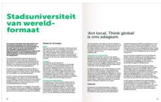
Tekstuele spread, tekst en quote

Bij een inspirerende spread gebruiken we de fotowolk, een groot contrast in typografie en/of de verbindende vorm.