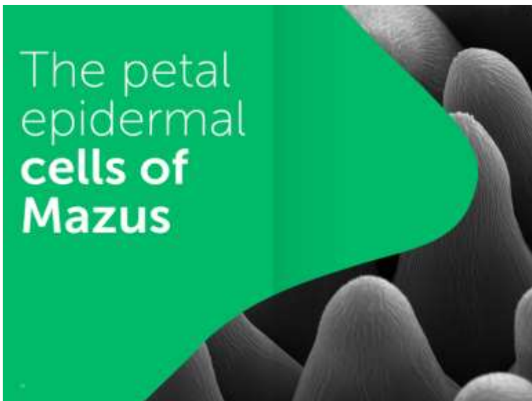
Tussenspagina, verbindende vorm met quote en beeld