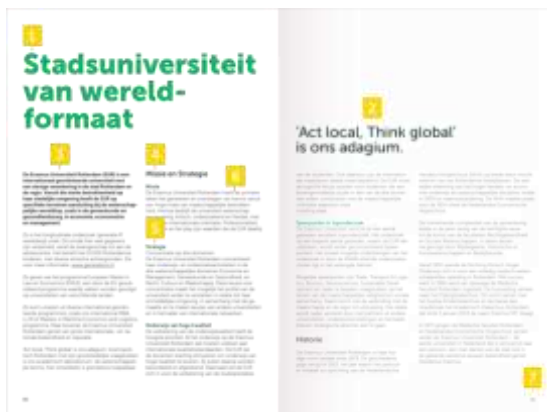
Hiërarchie, voorbeeld 2